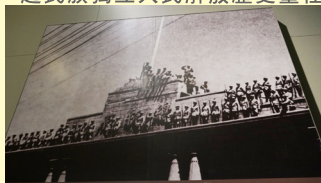
第三部份：中國共產黨肩負起民族獨立人民解放歷史重任