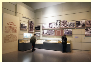
第四部份：建設社會主義新中國