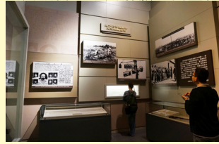
第三部份：中國共產黨肩負起民族獨立人民解放歷史重任